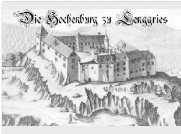
Lenggries, die Hohenburg

Tagesfahrten werden zur Hohenburg nach Lenggries, nach Dießen, nach Burghausen und zur Burg Trausnitz in Landshut unternommen.