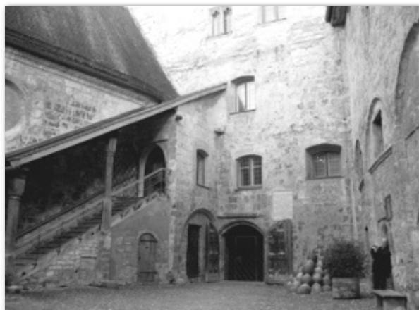
Burghausen, im Südhof der Burg